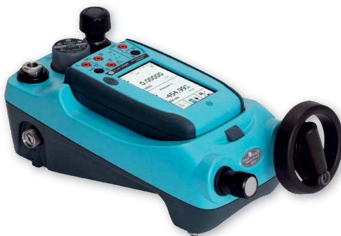
Medición y generación de presión en intervalos modificables, desde 25 mbar (10 pulgadas H 2 O) a 1000 bar (15000 psi)