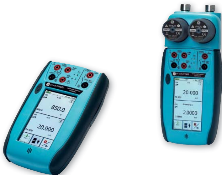
Medir y proveer mA, mV, V, ohmios, frecuencia, RTD y termocuplas

Este diseño y concepto, sencillos y refinados a la vez, combinan – por primera vez – un calibrador de magnitudes eléctricas con la más avanzada medición y generación de presión. Ya no es necesario resignarse a capacidades inferiores en un campo a favor de otro.